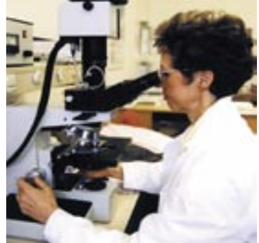
Die neu gewonnenen Erkenntnisse kommen allen Patienten, die an der Studie teilnehmen, zugute.

Die Ergebnisse werden regelmäßig überprüft und mit den teilnehmenden Spezialisten in den Studienzentren diskutiert. Wenn sich bei einer Analyse eine Therapie als zu nebenwirkungsreich und/oder unwirksam erweist, wird die Studie abgebrochen. Auch wenn sich keine klaren Hinweise ergeben, dass die neue Methode den anderen Standardtherapien deutlich überlegen ist, kann die Studie abgebrochen werden. Die Ergebnisse der Studie werden durch statistische Berechnungen abgesichert. Solche Erkenntnisse können auch für zukünftige Pati-